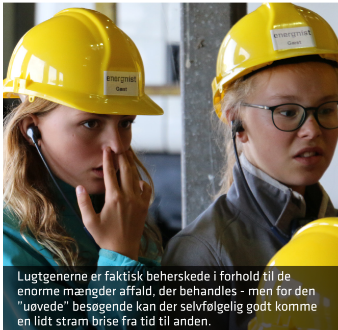
Lugtgenerne er faktisk beherskede i forhold til de enorme mængder affald, der behandles - men for den "uøvede" besøgende kan der selvfølgelig godt komme en lidt stram brise fra tid til anden.