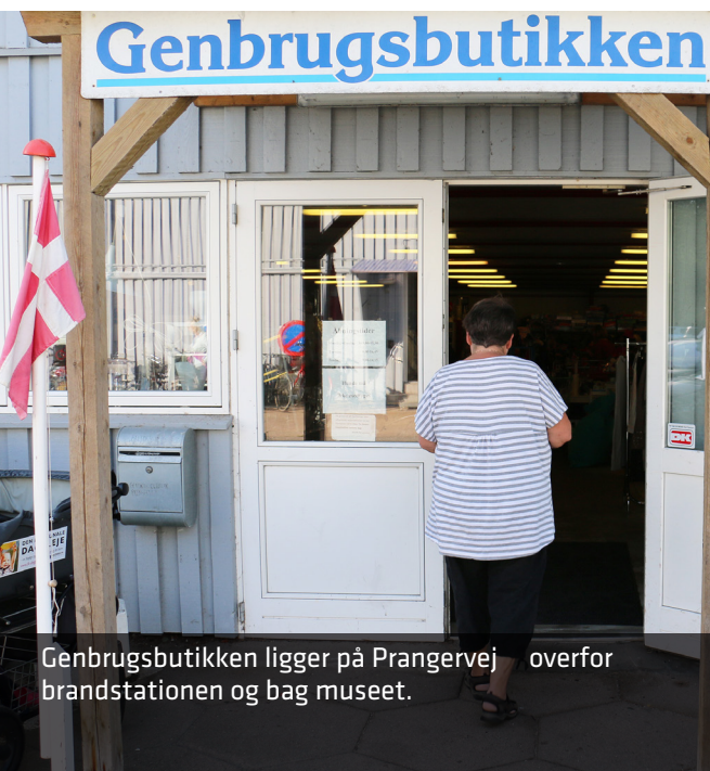
Genbrugsbutikken ligger på Prangervej overfor brandstationen og bag museet.