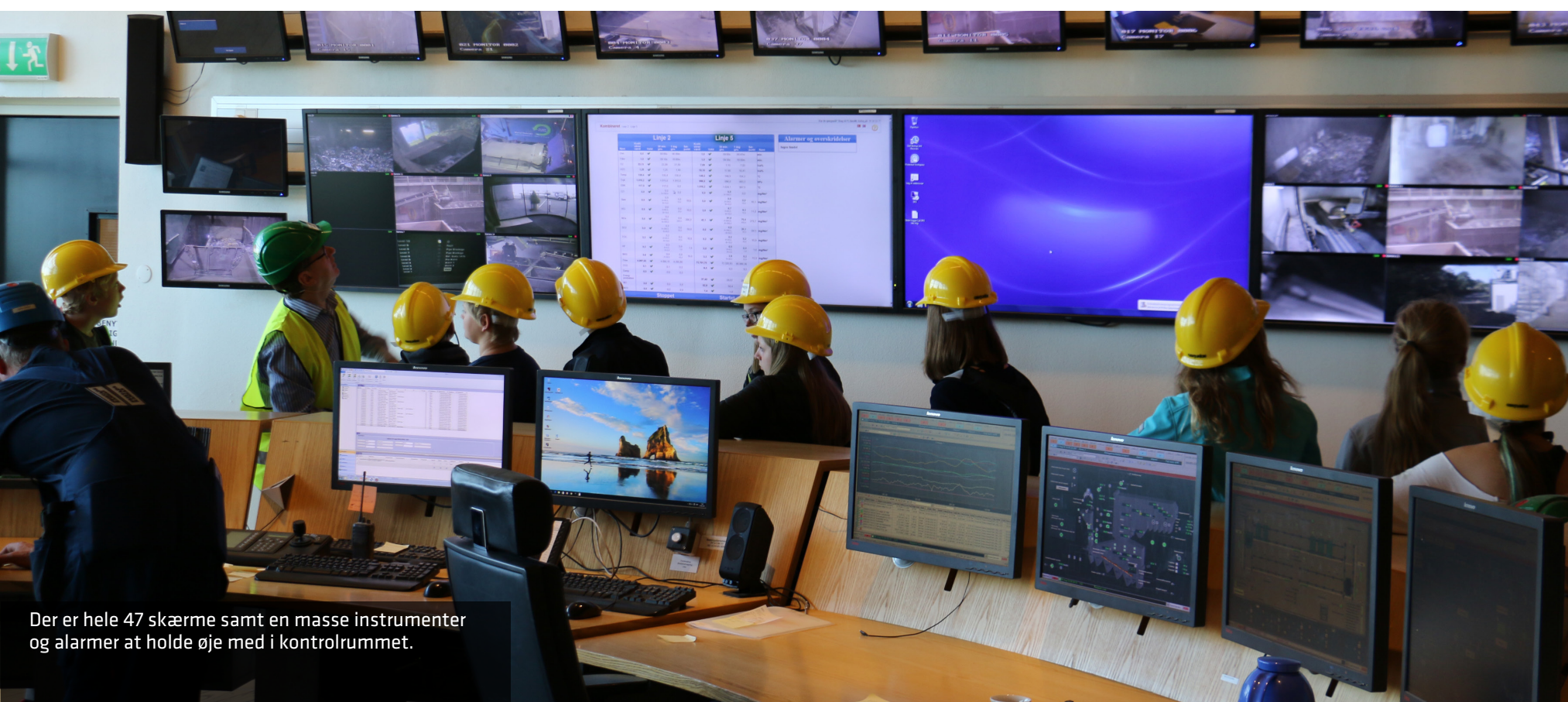
Der er hele 47 skærme samt en masse instrumenter og alarmer at holde øje med i kontrolrummet.