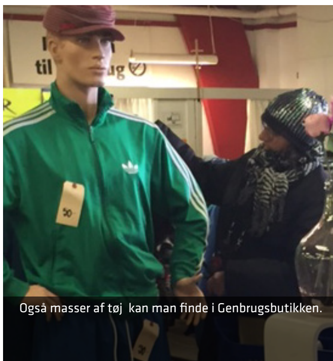
Også masser af tøj kan man finde i Genbrugsbutikken.