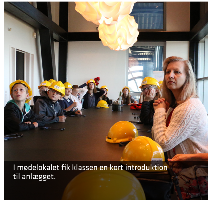
I mødelokalet fik klassen en kort introduktion til anlægget.